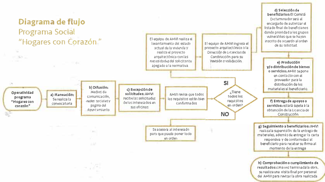
Diagrama de flujo Programa Social "Hogares con Corazón"