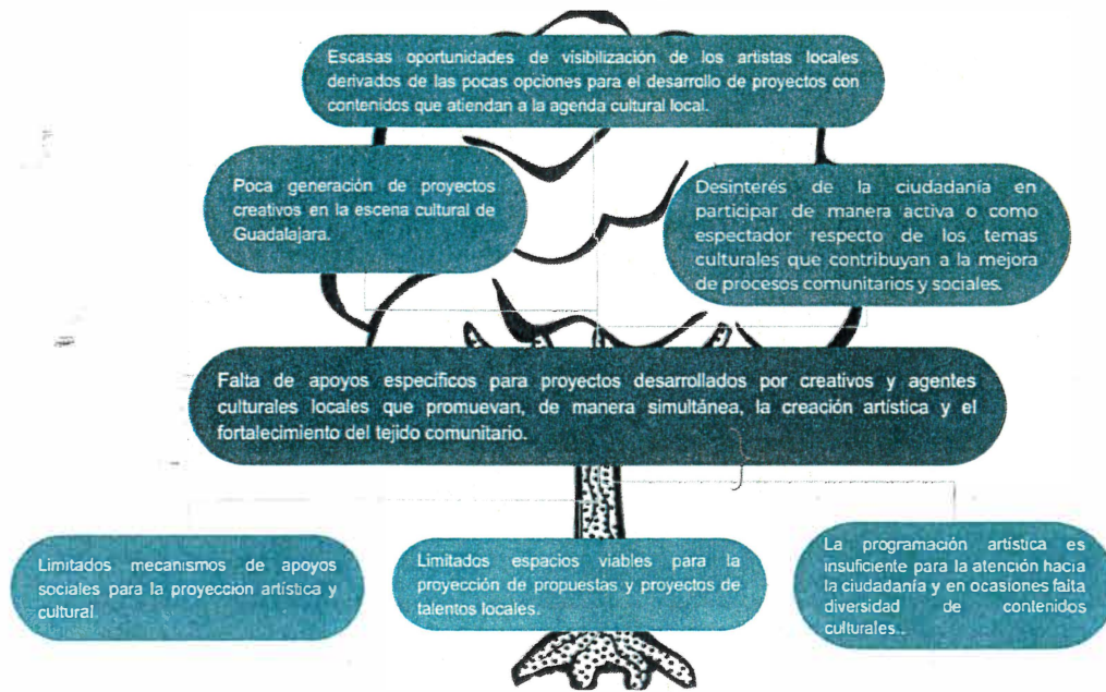
Figura 1. Árbol del problema